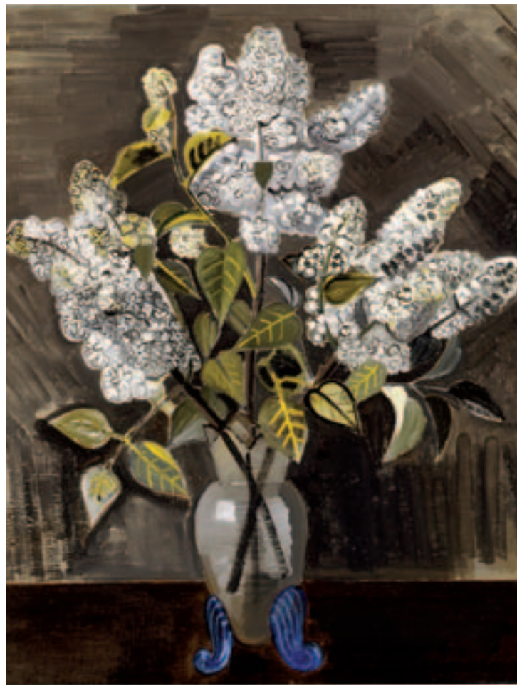
JEAN BRUSSELMANS, SERINGEN , 1931