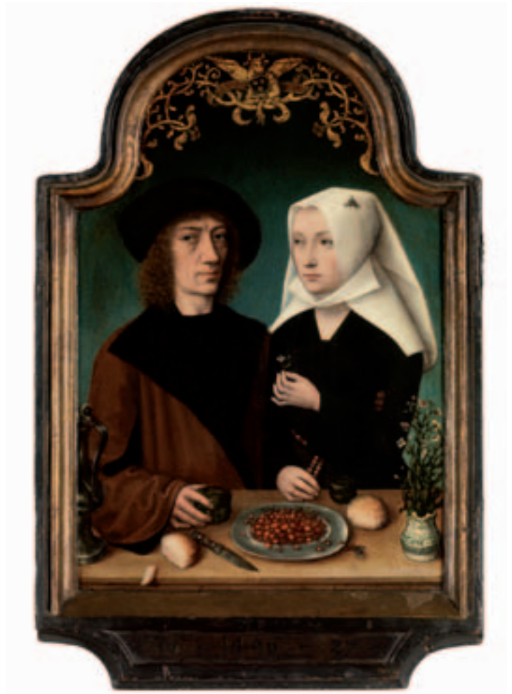
MEESTER VAN FRANKFURT, DE SCHILDER EN ZIJN VROUW, 1496