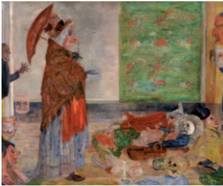
JAMES ENSOR, VERBAZING VAN HET MASKER WOUSE, 1889