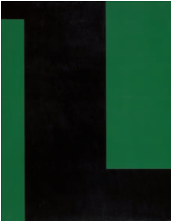
AMÉDÉE CORTIER, GROEN/ZWART , 1970