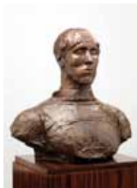
Zelfportret * 1911 (SMM)