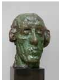
Masker van een potten- bakker. Edgard Tytgat 1908