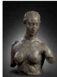
Nel - torso 1907