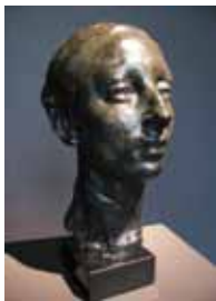
Nel * 1907 (SMM)