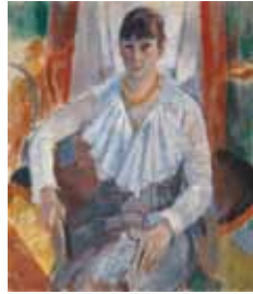
Dame in het wit 1915