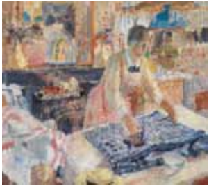
De strijkster 1912