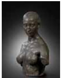
Nel - torso 1907