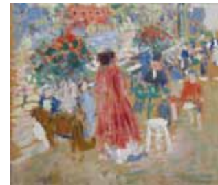
Terras, kruidtuin ** 1907 (SMM)