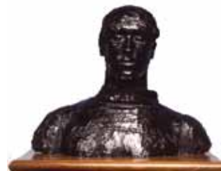
Zelfportret * 1911 (SMM)