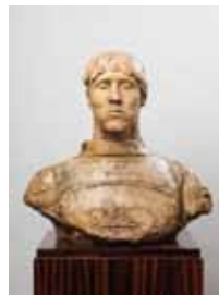
Zelfportret * 1911 (SMM)