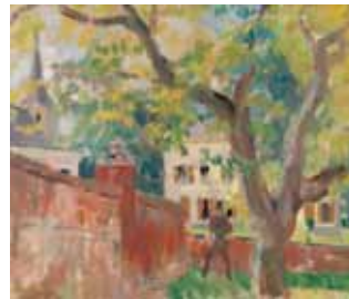
De oude notelaar B 1912