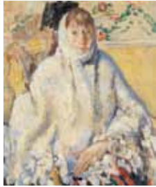
De zieke met de witte sjaal 1912