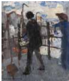
De schilder op de Hoogbrug in Mechelen 1908