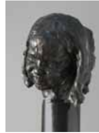
Kwijlende baby 1908