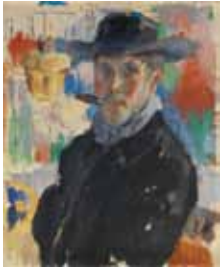
Zelfportret met sigaar 1913