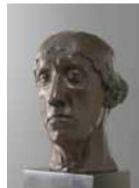
De schilder Edgard Tytgat 1910