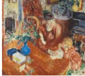
De opvoeding 1912