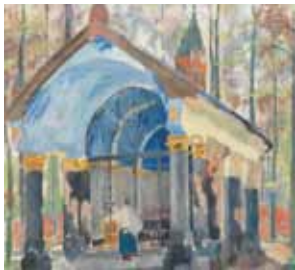
Kapel van Onze Lieve Vrouw van Welriekende 1913