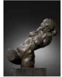
Het zotte geweld / De dwaze maagd - torso 1912