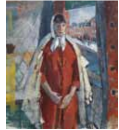
Vrouw aan het venster 1915