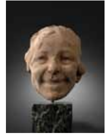
Glimlachend meisje 1908