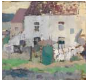
Witte gevels en tuin in Bosvoorde 1907