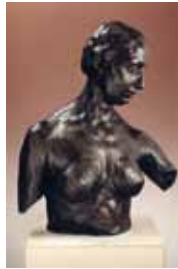
Nel - torso * 1907 (SMM)