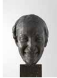
Lachend masker 1910